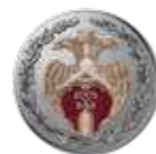
В наградной комплект входит миниатюрная копия

Нагрудный знак представляет собой трехсоставную медаль серебристого цвета с выпуклым бортиком с обеих сторон, в центре которой изображен объемный герб Учреждения золотистого цвета.